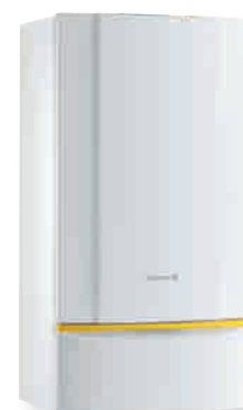
► INNOVENS MC 45/65/90/115 Chaudières murales moyenne puissance à condensation, chauffage seul