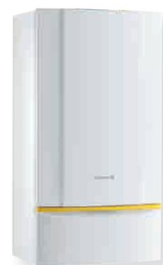
► INNOVENS MC 45/65/90/115 Chaudières murales moyenne puissance à condensation, chauffage seul