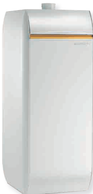
► ECODENS DTG 1300-24 Eco/V130 Chaudière au sol à condensation, mixte à accumulation intégrée