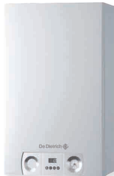
► MCX MCX 24/28 MI Chaudière murale à condensation, mixte à micro-accumulation