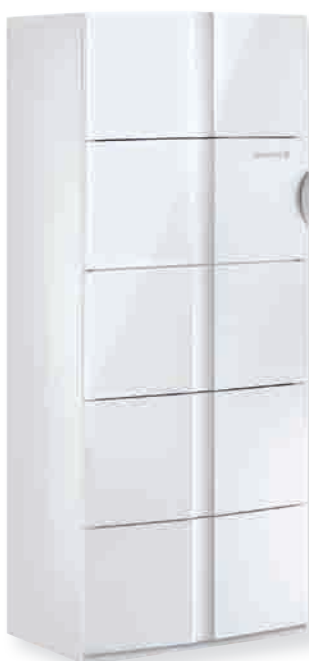
► SOLNEO SGC 24 SOL Chaudière au sol à condensation, mixte à accumulation solaire intégrée