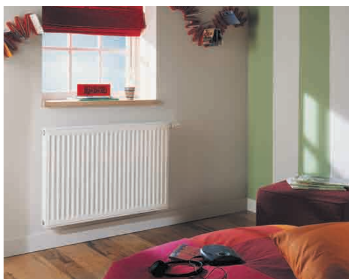
► SAMBA ET SAMBA PROGRESS Gammes de radiateurs panneaux à eau chaude