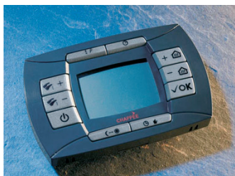
► Tableau de commande amovible

Chaudières mixtes à mini-accumulation, à accumulation intégrée (ballon de 45 litres) et à accumulation séparée (ballon de 100 ou 150 litres)