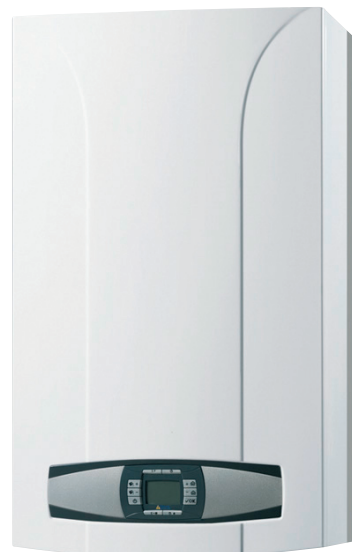
► LUNA 3 HTE PRIME 1.24