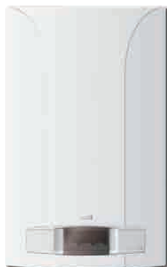
► INITIA 3 MAX 2.24