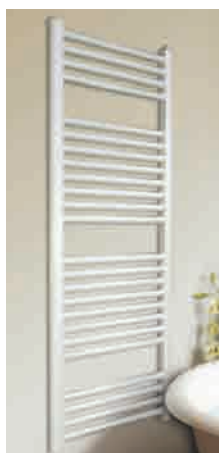
► MAÉLINE Gamme de sèche-serviettes à eau chaude, électrique et mixte