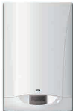
► INITIA 3 DUO 3.24