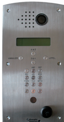
ART. PIC4 Platine digitale inox à défilement (prédisposée pour recevoir une caméra vidéo)