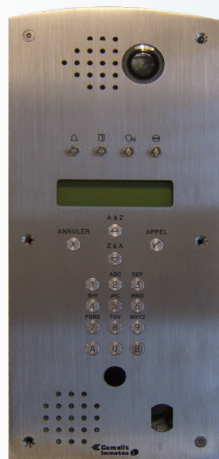
ART. PIC4/MH Platine digitale inox, module voix de synthèse avec LED de signalisation