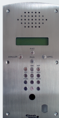
ART. PIC3 Platine digitale inox à défilement