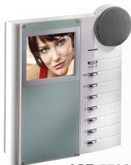
ART. 5722BM Moniteur BRAVO version mains libres couleur avec Boucle Magnétique (ART.5721BM version N/B)