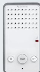
ART. 6228WBM Combiné audio mains libres EASYCOM avec Boucle Magnétique blanc. (ART.6228BBM version couleur noir)