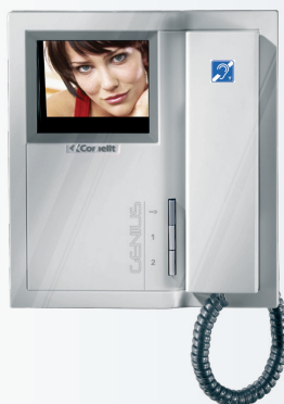
ART. 5802BM Moniteur GENIUS version couleur avec Boucle Magnétique (ART.5801BM version N/B)